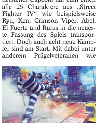
Potzblitz, in „Super Street Fighter IV“ geht's zur Sache.

Für die „Super-Street-Fighter“-Serie ertönt der Gong zur nächsten Runde: Die vierte Ausgabe des Prügelspiels liegt vor, und zwar zum günstigen Preis von knapp 35 Euro. Der japanische Spielehersteller Capcom hat zum einen alle 25 Charaktere aus „Street Fighter IV“ wie beispielsweise Ryu, Ken, Crimson Viper, Abel, El Fuerte und Rufus in die neueste Fassung des Spiels transportiert. Doch auch acht neue Kämpfer sind am Start. Mit dabei unter anderem Prügelveteranen wie