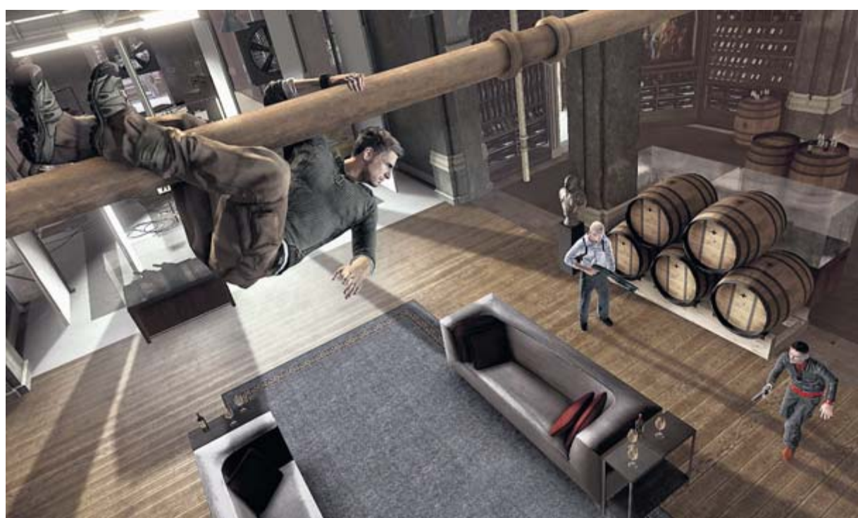
Gegner beobachten, dann in einem günstigen Moment ausschalten: In „Splinter Cell Conviction“ kommt der Spieler in Rambo-Manier nicht weit.